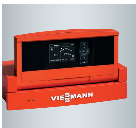
Regulator Vitotronic z dużym wyświetlaczem graficznym i o intuicyjnej obsłudze