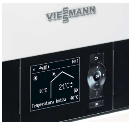
Nowy regulator Vitotronic 200 zapewnia jeszcze bardziej intuicyjną obsługę instalacji grzewczej.