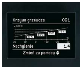
Prosta obsługa regulatora Vitotronic dzięki prowadzeniu użytkownika przez menu i możliwość prezentacji graficznej, np. charakterystyk grzewczych

Kompaktowy, stojący kocioł kondensacyjny z zabudowanym zasobnikiem c.w.u. łądowanym warstwowo lub przez węzownicę grzewczą, o wysokiej wydajności ciepłej wody i wyjątkowo łatwej obsłudze.