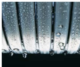
Wymiennik ciepła Inox-Radial z kwasoodpornej stali szlachetnej odporny na duże obciążenia termiczne