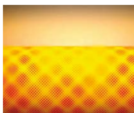
Palnik promiennikowy MatriX z układem kontroli spalania