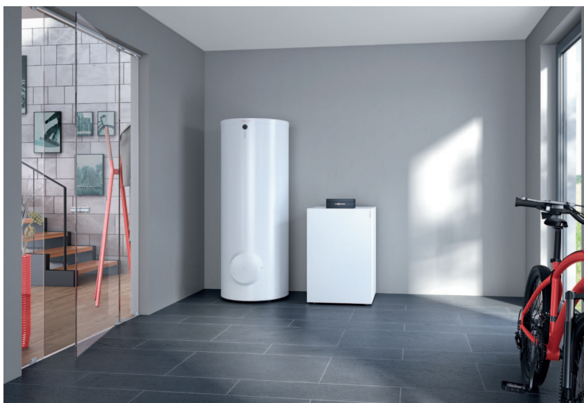
Pompa ciepła Vitocal 200-G z pojemnościowym podgrzewaczem c.w.u. Vitocell 100-W (z lewej)

Vitocal 200-G posiada certyfikat KEYMARK